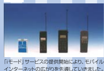
「iモード」サービスの提供開始により、モバイルインターネットの広がりを先導していきました。