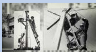
電電公社は、五次にわたる5ヶ年計画を通じて、日本全国の電話環境の整備に邁進しました。

東京、名古屋、大阪の3地域にて、世界で初めてのISDN(Integrated Services Digital Network:商用サービス総合デジタル網)サービス、「INSネット64」の提供を開始しました。当時の最大伝送速度は128kbps(64kbps 2回線)でした。