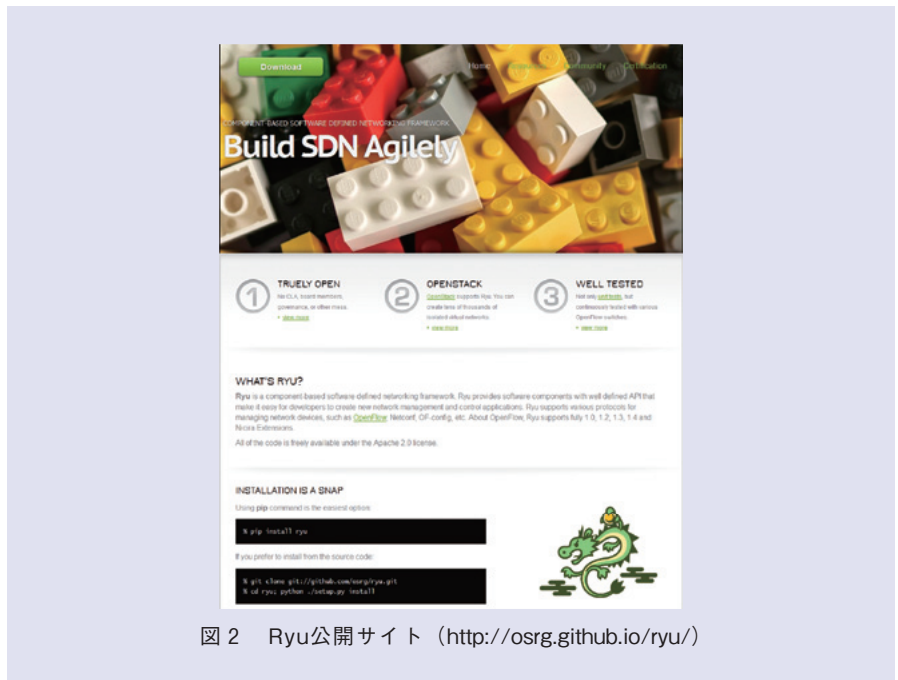
図2 Ryu公開サイト (http://osrg.github.io/ryu/)