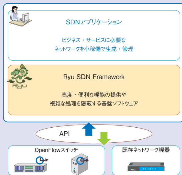
図1 Ryu SDN Frameworkの概要

OpenFlowとは、ONF (Open Networking Foundation) にて策定されている、コントロールプレーンとデータプレーン間のAPI仕様です。SDNのアプローチを実現するための、もっとも主要なAPI仕様として広く注目を集めています。仕様に準拠したデータプレーンをOpenFlowスイッチ、同じ